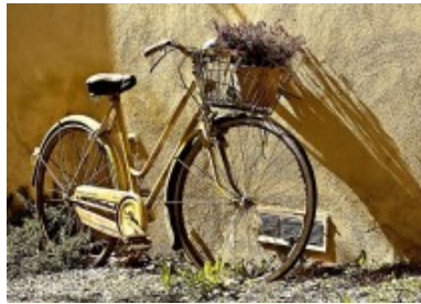
Pintura para bicicletas