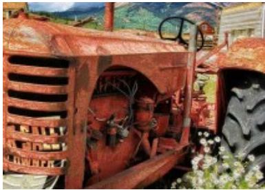
Pintura para óxido