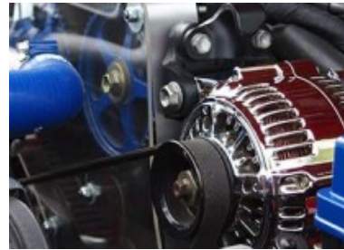
Pintura para motores