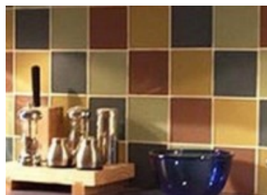
Pintura para azulejos de cocina