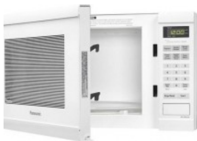
Pintura para microondas