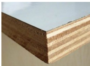
Pintura para formica