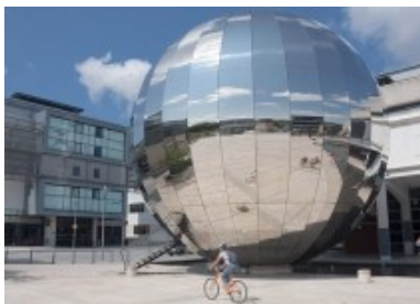
Pintura para aluminio