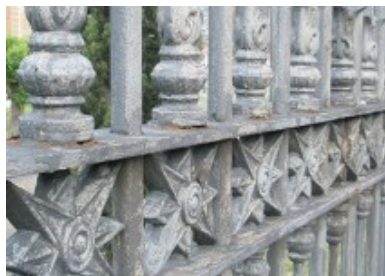
Pintura para rejas