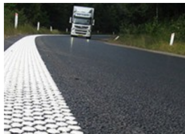
Pintura para tráfico